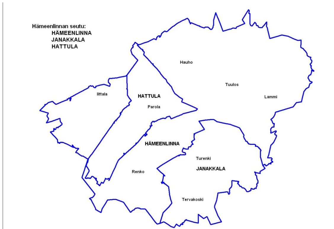
Kuva 1 Hämeenlinnan seudun alue.

Hämeenlinnan kaupungin joukkoliikenneviranomaisen alueeseen kuuluu kolme kuntaa: Hämeenlinna, Janakkala ja Hattula. Väestömäärä on noin 94 000 asukasta.